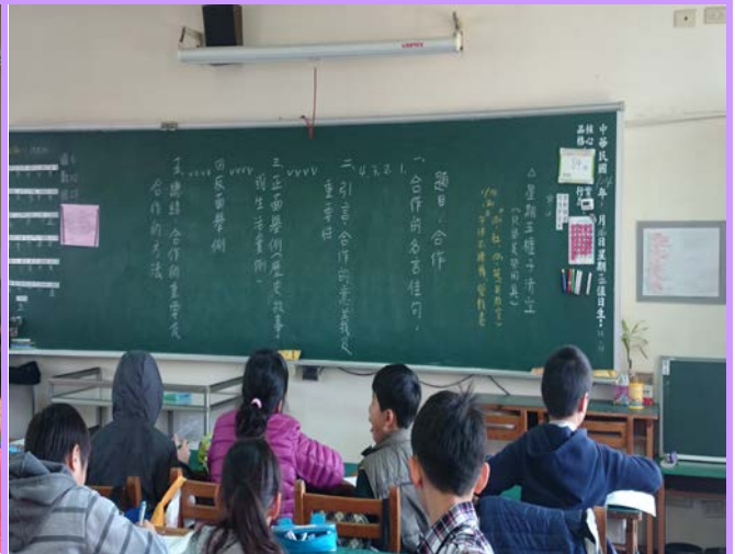
將品格故事融入教學中引導學生思考