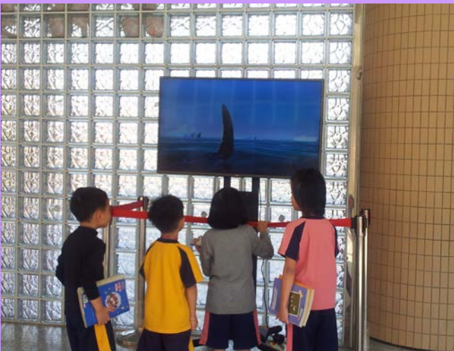
利用下課時間在水晶牆前播放品格小短片