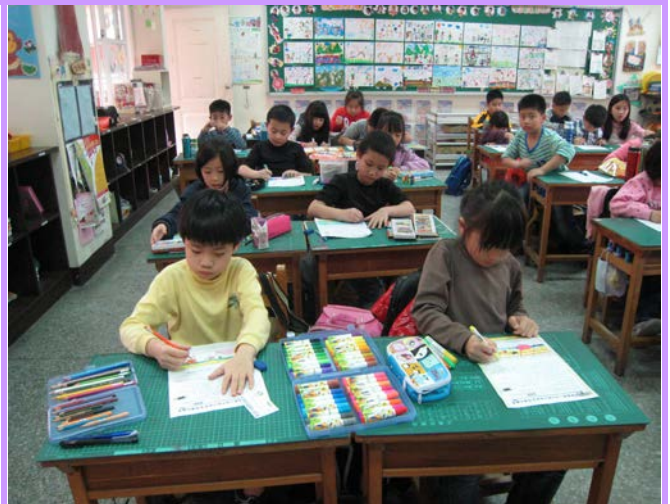
每月 1 主題的品格學習單