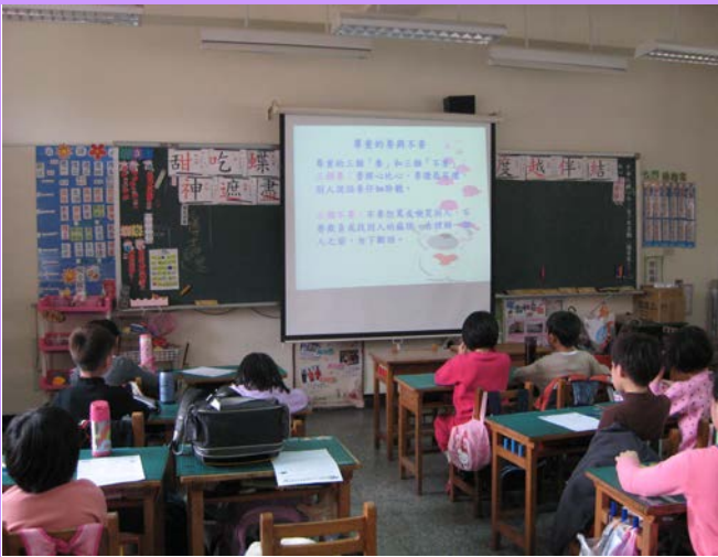
每月播放品格教育小短片